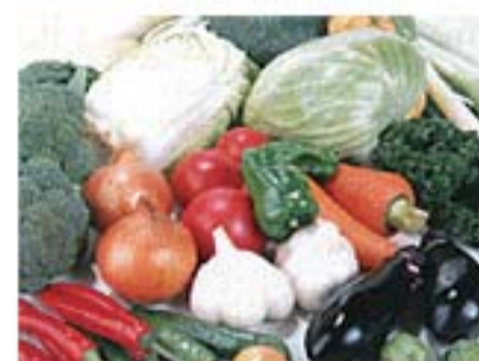
調理・飲食時の衛生管理