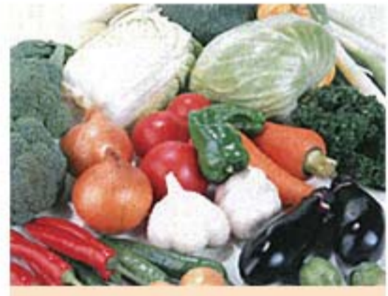
調理・飲食時の衛生管理

このため、施設や機具の除菌ばかりでなく、臨床に使用できます。微生物に幅広い殺菌性を示しながら、人間に無害な理由は、高等動物と微生物の細胞壁構造の違いにあります。ウイルスの感染性をなくす強い効果も証明されています。